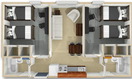
双床房、公共客厅/厨房、双洗手间

费用包含：项目申请费、学费、住宿费、校内资源使用以及管理费、行程中涉及的考察地点导览费用、境外机场接送大巴费等。（住宿环境：美国纽约市立大学皇后学院公寓。）