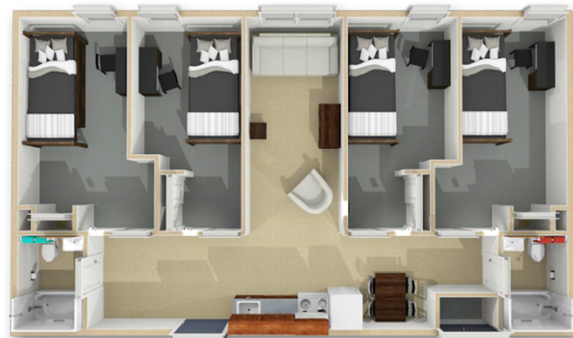
单人房、公共客厅/厨房、双洗手间