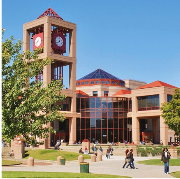
纽约市立大学皇后学院 (Queens College, City University of New York)