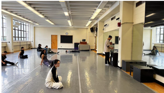
皇后学院戏剧舞蹈系 (Department of Drama, Theatre, and Dance)